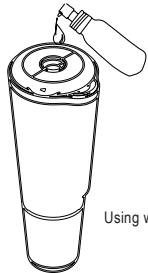
Using water based lubricant