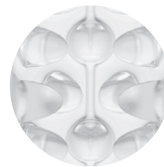
A mixture of firm & rounded tits

В соответствии с европейскими директивами на наши продукты действует гарантия в рамках, определенных законом.