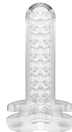
Full inner texture